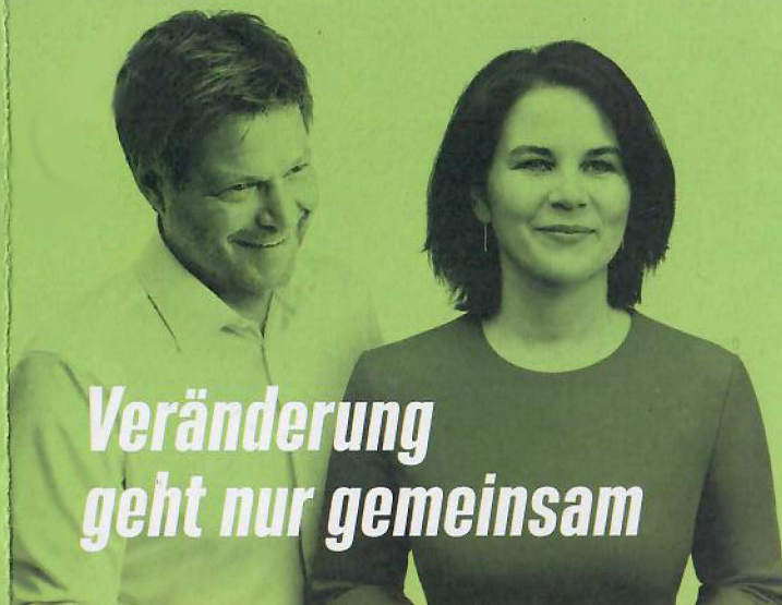
Robert Habeck & Annalena Baerbock